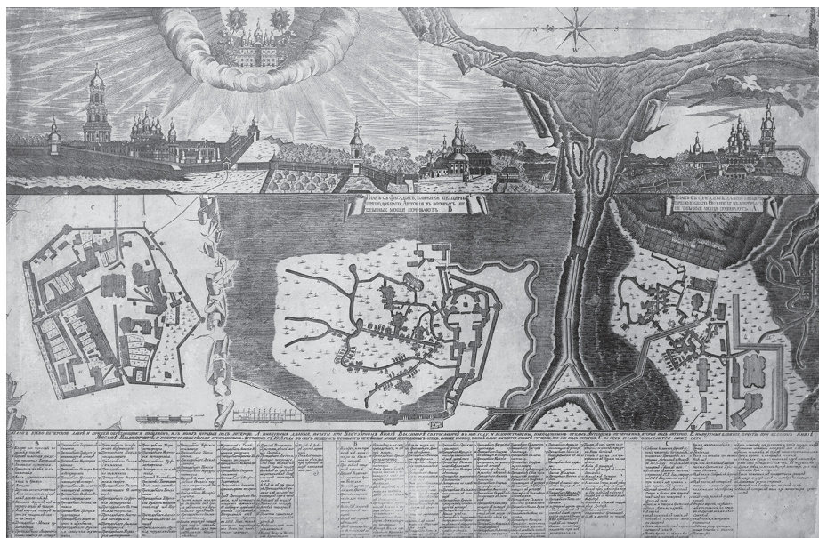
План Киево-Печерской лавры с лабиринтами Ближних и Дальних пещер

Никон (гг. рожд. и см. неизв.) Киево-Печерская лавра. 1812–1821 гг. Гравюра на шелке. 63,5:98 см. Государственный музей украинского изобразительного искусства УССР, Киев» 3 .