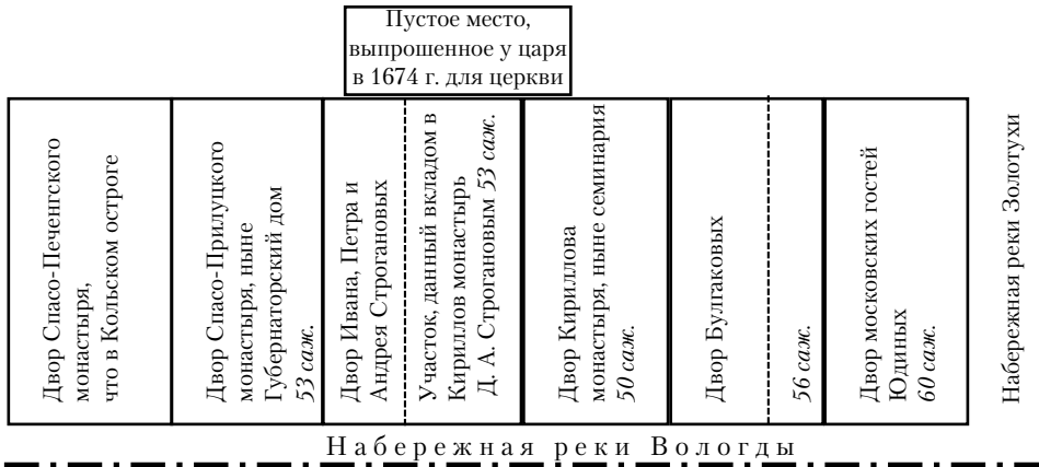
Из статьи: Лебедев А. Кирилло-Иоанно-Богословская церковь при Вологодской духовной семинарии // ВЕВ. 1901. С. 42.