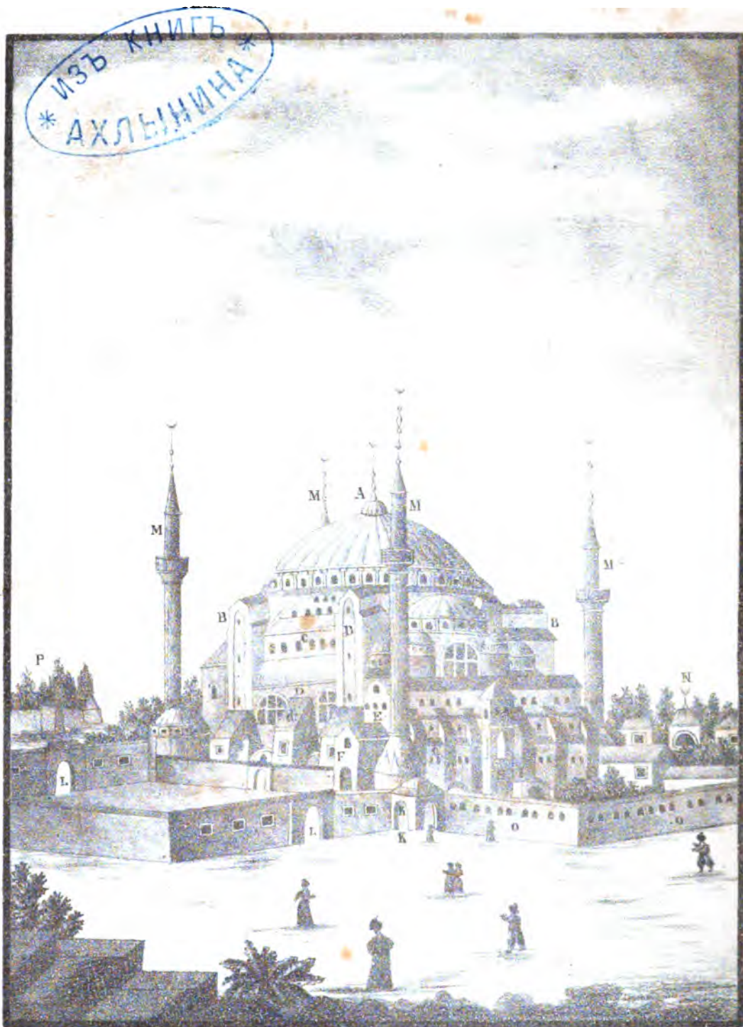
Северный видъ Константинопольской Софійской Церкви.